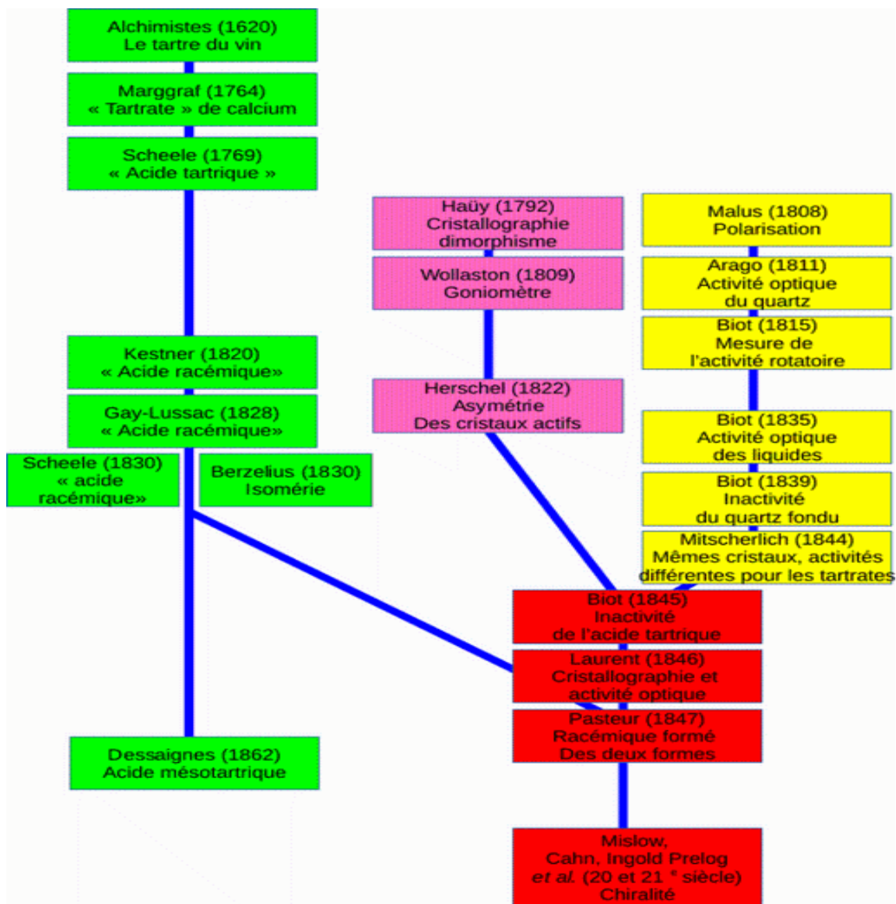
Figure 1. Histoire des travaux qui ont conduit à l'identification du concept de chiralité, en chimie (This, 2021a). Cet exemple (déjà simplifié) montre notamment que la recherche scientifique n'avance pas linéairement. De ce fait, les SRB peuvent utilement restituer l'avancement des sujets par de telles cartes conceptuelles, dont un prototype célèbre est la « Carte de Tendre » (figure 2).

publiées par d'autres (cas d'articles de synthèse).