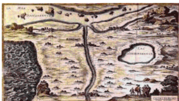
Figure 2. La Carte de Tendre est une façon graphique de représenter des idées abstraites, ici, les sentiments (Colombey, 1856). Elle représente un pays imaginaire appelé « Tendre », imaginé au XVII e siècle et inspiré par différentes personnalités dont Catherine de Rambouillet. On y retrouve tracées les étapes de la vie amoureuse, selon les Précieuses de l'époque.

les notions et les concepts ont évolué, et qu'il y a lieu d'éviter des confusions. Par exemple, les termes « albumine », « chlorophylle », « lécithine » ont respectivement été introduits pour désigner des matières qui se sont révélées être des mélanges, de sorte que leur usage au singulier doit être prudent : on ne peut plus parler de « l'albumine » et l'on doit parler « des albumines », puisque le terme « albumine » désigne aujourd'hui une catégorie particulière de protéines (IUPAC, 2006). De même, pour le terme « chlorophylle », qui désigne aujourd'hui une catégorie de pigments, ou le terme « phospholipide », qui désigne un ester chologique d'un acide phosphatidique (IUPAC, 2009 ; This, 2021b).