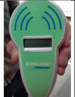
Figure 2 : Appareil de lecture du transpondeur

L'IFCE publie sur son site internet ( ifce.fr ) la liste officielle des agents identificateurs, vétérinaires et agents de l'IFCE. Le transpondeur doit être absolument implanté avant que le relevé du signal soit fait.