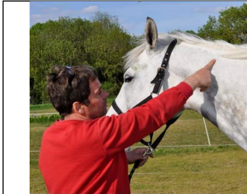
Figure 1 : Indication de la zone où est implantée la puce ou transpondeur

La pose d'un transpondeur électronique : de la taille d'un grain de riz, le transpondeur (ou puce) est implanté dans le tiers supérieur gauche de l'encolure ( Figure 1 ). Ce transpondeur est inoffensif, ne gêne pas l'animal, et porte un code lisible par un lecteur spécifique ( Figure 2 ). L'enregistrement de ce code par le SIRE suivra la réception de la déclaration d'implantation par l'identificateur (vétérinaire ou agent de l'IFCE).