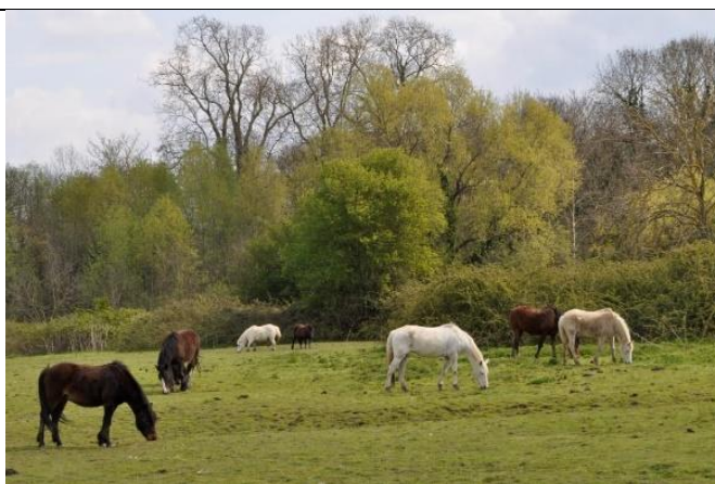
Figure 6 : Tous les équidés présents sur le territoire doivent être identifiés

• Institut Français du Cheval et de l'Équitation (IFCE) : https://equipedia.ifce.fr/economie-et-filiere/reglementation/identification