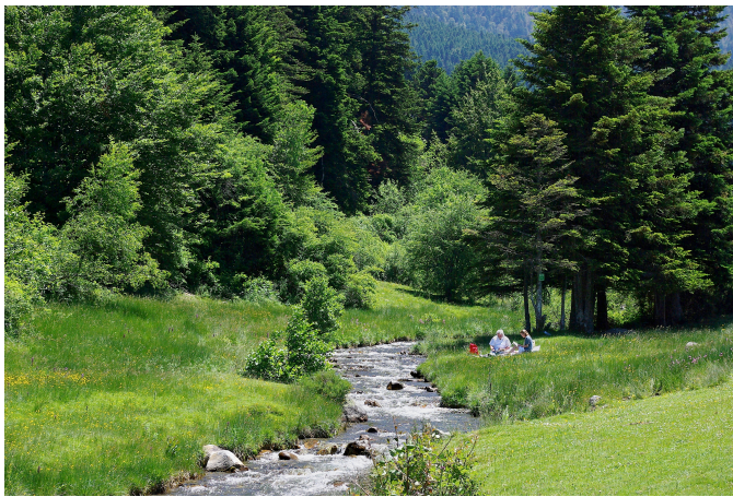
Figure 4. Ruisseau d'Artigou, Payolle, Vallée de Campan, Hautes-Pyrénées

La dimension spatiale des écosystèmes forestiers est cruciale lors de l'analyse économique et la conception des politiques publiques. Les mesures de conservation sont la plupart du temps prises à l'échelle des peuplements ou de la propriété, car l'objectif est d'aboutir à un changement dans la décision de production des propriétaires fonciers, mais les avantages écologiques sont mesurés à l'échelle du processus biologique (au niveau des habitats pour la préservation de la biodiversité, au niveau des bassins versants pour la protection de la qualité de l'eau). Par conséquent, les politiques environnementales doivent être adaptées à l'échelle du bien public à protéger. Souvent, le problème de la