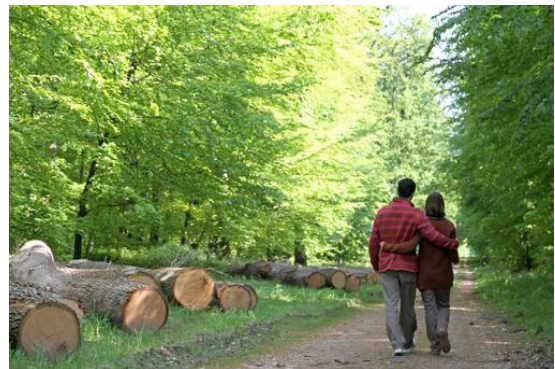
Figure 2. En forêt de Fontainebleau - En contexte périurbain, les opérations de coupe ne sont pas toujours bien perçues des citoyens

Les forêts étant multifonctionnelles, il en résulte que les mesures de gestion forestière ont des impacts multiples. Dès lors, si une politique vise à promouvoir la fourniture d'un SE particulier, elle est également susceptible d'avoir des impacts indirects et potentiellement importants sur les autres services. Par exemple, l'augmentation de l'âge de coupe dans une forêt peut augmenter sa valeur récréative car les promeneurs préfèrent en général les vieux arbres ; cela est bon pour le stockage du carbone (dans une certaine limite) et pour la biodiversité dans certains cas. Toutefois, une activité récréative importante en forêt peut également avoir un impact négatif sur la biodiversité et augmenter le risque d'incendie. Il est alors important d'avoir une bonne connaissance des interactions entre SE et des impacts indirects des politiques publiques. Il est donc bon de réfléchir à la conception d'une politique publique qui prend en compte l'ensemble des SE.