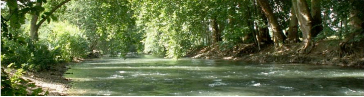
Figure 2. Site Natura 2000 dans le Vexin Français

Dans ce cas, le gestionnaire de la forêt ne modifiera ses pratiques que si les incitations fournies sont supérieures aux coûts. Mais dans le cas d'une réglementation, même différenciée, l'autorité publique ne peut tenir compte des différences de coûts entre les propriétaires. En effet, les coûts des mesures de préservation des SE, les coûts d'opportunité (c'est-à-dire les bénéfices perdus en modifiant les pratiques), et les coûts de mobilisation de bois ne sont des informations précisément connues que des propriétaires. Et seuls les propriétaires forestiers présentant les coûts les plus faibles et dégagant une rente monétaire en recevant une incitation supérieure à leurs coûts, seront intéressés à participer au programme de préservation. Les asymétries d'information entre l'autorité publique et les propriétaires privés posent d'autres problèmes. Par exemple, il est très difficile ou coûteux de contrôler si les mesures sont correctement réalisées. Il est alors possible de proposer des contrats basés sur la rémunération de l'effort ou de l'investissement. En revanche, la mise en œuvre d'incitations publiques peut engendrer des coûts de transaction (coûts de recherche d'information, de négociation et de contrôle) élevés, lors de la rédaction et l'exécution des contrats.