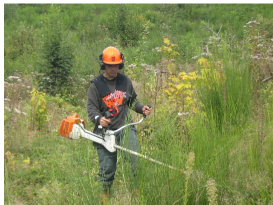
Figure 3. Dégagement à la débroussailleuse (CFPPA Bourgogne)

Les coupes sont l'outil principal du sylviculteur : couper un arbre est donc une opération banale. Elles visent à : i) régénérer le peuplement en favorisant la fructification et les semis ; ii) améliorer le peuplement en l' éclaircissant pour favoriser les tiges d'avenir ; iii) récolter les arbres arrivés à une maturité correspondant à l'objectif fixé (quantité et qualité). Ces trois objectifs de coupe peuvent parfois se être combinés. Les travaux de régénération visent au renouvellement des arbres par ensemencement naturel ou par plantation, dans ce dernier cas souvent après travail du sol. Ils sont suivis par des travaux de contrôle de la végétation concurrente herbacée et arbustive (fig.3) nécessaire au bon développement des jeunes plants ou semis, tandis que les opérations de taille et d'élagage améliorent la forme et la qualité des arbres. Coupes et travaux peuvent être pour tout ou partie orientés vers d'autres objectifs : fonctions environnementales, amélioration paysagère, etc.