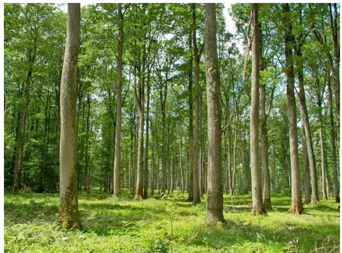
Figure 2. Forêt Domaniale de Tronçais (Allier) : futaie régulière de chêne

i) d'une futaie régulière dans laquelle les arbres, d'une ou plusieurs essences, ont à peu près le même âge et donc les mêmes dimensions (fig. 2) ; ii) d'une futaie irrégulière dans laquelle les arbres, d'une ou plusieurs essences, sont d'âge et donc de dimensions différentes ; iii) du taillis sous futaie , système mixte hérité du passé, et en voie de transformation aujourd'hui ; iv) du taillis simple (voir plus haut). Le sylviculteur choisit régime sylvicole et mode de traitement en tenant compte des caractéristiques des essences et de ses objectifs de gestion.