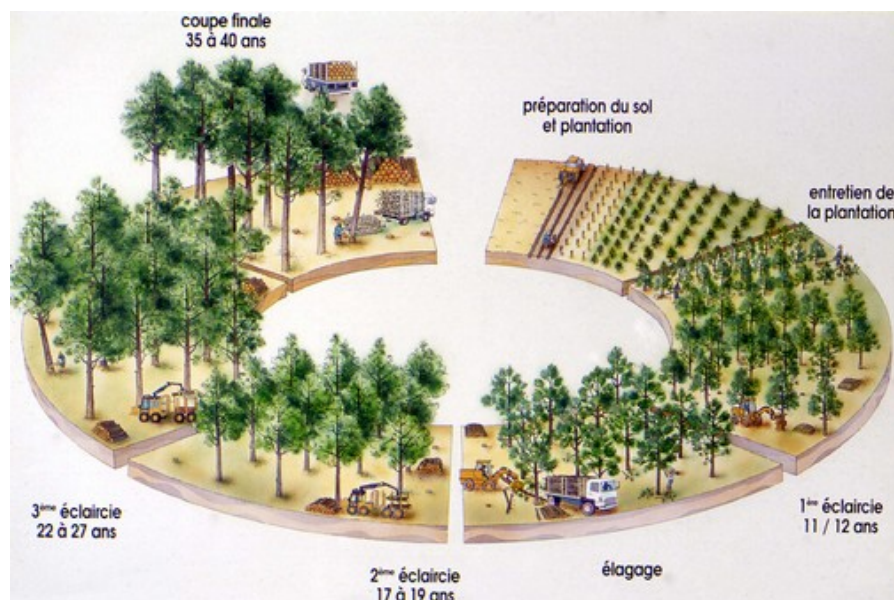
Figure 4. Exemple de cycle des opérations sylvicoles pour une futaie régulière monospécifique de pin maritime conduite de manière dynamique. Le cycle commence à la préparation du sol suivie de la plantation. Puis viennent les opérations d'entretien des jeunes plants (principalement contrôle de la végétation adventice). L'amélioration du peuplement se déroule ensuite avec les éclaircies successives au profit des tiges d'avenir ; elle peut

comporter, selon les cas, des travaux d'élagage pour l'obtention de bois sans noeuds. Le schéma concerne une parcelle où tous les arbres ont le même âge. Pour une forêt de 100 hectares, on peut imaginer sa division en 10 parcelles de 10 hectares, chacune d'entre elles correspondant à une classe d'âge, du plus jeune à celui de l'âge d'exploitabilité. Cette structuration permet ainsi au niveau de la forêt une production régulière dans le temps de tous les types de bois, des petits bois d'éclaircie aux plus gros diamètres, ainsi qu'un volume de travaux constant.