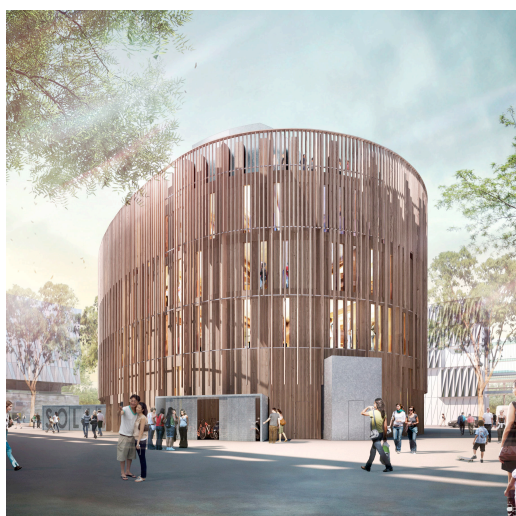
Figure 8. Le pôle bois Atlanbois à Nantes ; bâtiment B