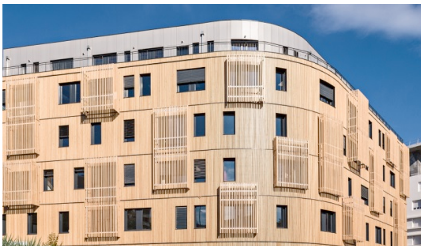
Figure 7. Bâtiment bois grande hauteur à Toulouse