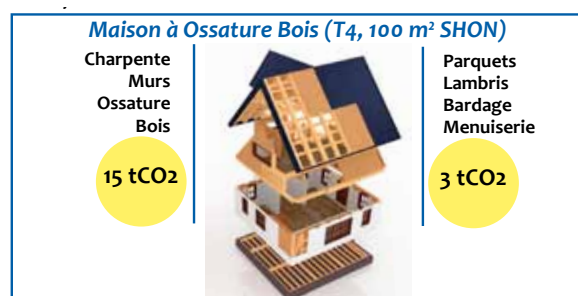
Figure 1. Stock de C (en CO 2 ) dans une maison à ossature bois - Un développement de la construction bois peut contribuer significativement à accroître le stockage du carbone

Afin d'évaluer l'ampleur de ce puits, il est nécessaire de prendre en compte les flux entrants, à savoir les quantités de produits bois récoltés en forêt et entrant dans les stocks de production, les stocks de produits présents sur le marché, les stocks de produits sortants, c'est-à-dire ceux devenus déchets et valorisés en énergie ou éliminés. Le GIEC a publié en 2013 un rapport précisant notamment les modalités d'évaluation de ce puits à l'échelle d'un pays.