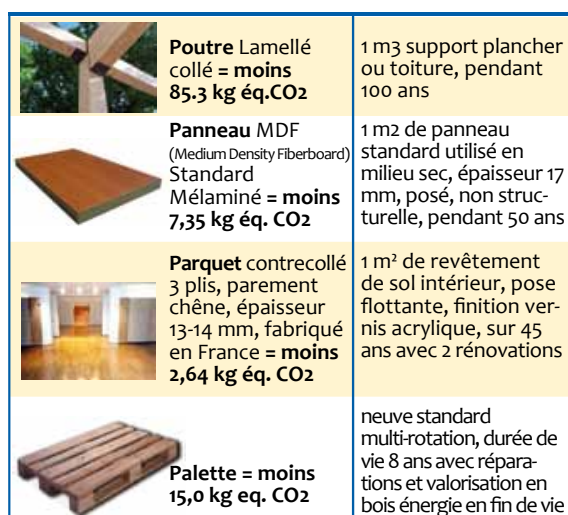
Figure 6. Empreinte carbone de différents produits bois. Les valeurs d'empreinte C négatives correspondent soit à une captation nette de GES sur le cycle de vie de produits (cas des produits de construction) soit à des émissions évitées de GES (cas de la palette) - Source FCBA

valorisait déjà la quantité de matériau biosourcé par m 2 de surface bâtie ; le label «Bâtiment Bas Carbone » (BBCA) proposé par l'association du même nom depuis début 2016 (fig.5), valorise également cette quantité de matériau biosourcé dans le bâtiment, en complément de l'empreinte carbone calculée par ACV.