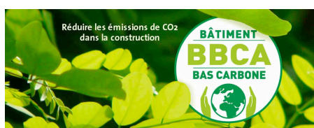
Figure 5. Label bâtiment bas carbone