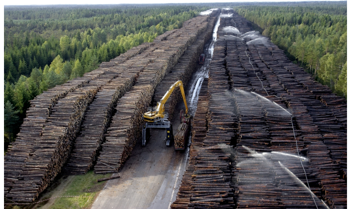
Figure 2. Après la tempête Gudrun en Suède (2005), piles de bois (13 m de haut, 1 km de long) stockées sous aspersion sur l'aérodrome désaffecté de Byholma totalisant 1 million de m 3

Les dommages aux arbres se classent en trois catégories : i) les dégâts primaires juste après la tempête, de type mécanique, ils se traduisent par la casse du tronc et/ou le renversement des arbres ; ii) les dégâts secondaires différés dans le temps : attaques d'insectes sous corticaux ou autres bio-agresseurs, et aussi feu, neige ou glace, voire d'autres coups de vent ; iii) les dégâts tertiaires, comme les pertes de production d'arbres détruits avant l'âge optimum d'exploitation. Responsables de plus de la moitié des dommages forestiers catastrophiques observés en Europe au cours des dernières décennies, les tempêtes sont, de loin, le premier facteur de pertes. On évalue généralement ces dégâts en volume de bois. La traduction complète de ces dommages en termes économiques, doit prendre en compte : les préjudices liés à : la baisse des prix du bois rendu usine, due à l'engorgement des marchés ; la dépréciation de la qualité du bois ; la hausse des coûts d'exploitation ; les coûts additionnels éventuels de transport à longue distance et de stockage (au titre des dommages primaires) ; les coûts additionnels dus à la dispersion des bois victime des dommages secondaires ; les pertes financières liées aux dommages tertiaires.