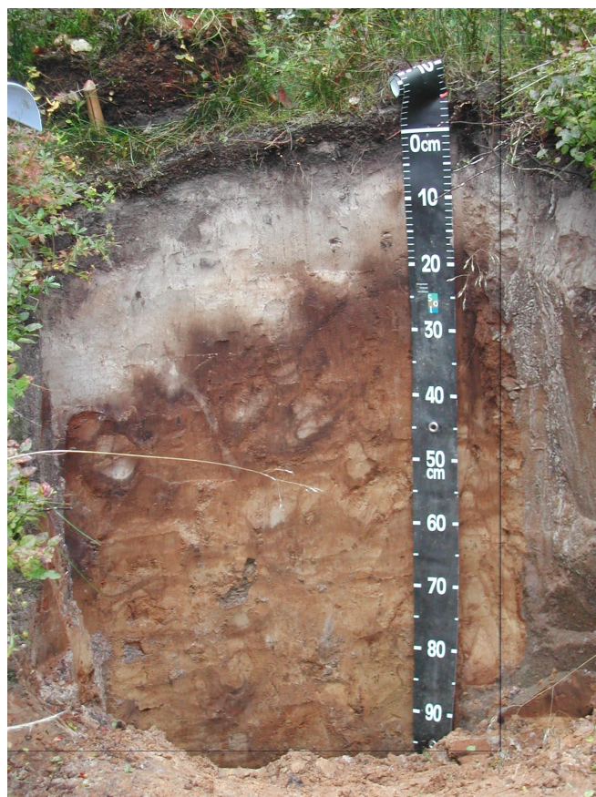
Figure 1. Sur ce profil de sol, on distingue nettement de haut en bas : un horizon noir de matière organique mal décomposée, un horizon blanc de sable très pauvre, une roche mère en blocs, colonisée par les racines des arbres.

- sa porosité , qui dépend de la texture et de l'arrangement des différents constituants dans l'espace, par exemple de la constitution de « structure » en agrégats de différentes formes (grumeaux, polyèdres ; les sols peu poreux, compacts, dans lesquels l'eau et l'oxygène circulent mal, sont difficilement colonisables par les racines des plantes ; les sols très poreux, à cause d'une forte teneur en sable ou éléments grossiers, retiennent mal l'eau et les éléments minéraux.