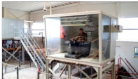
Figure 2. Conducteur de scie