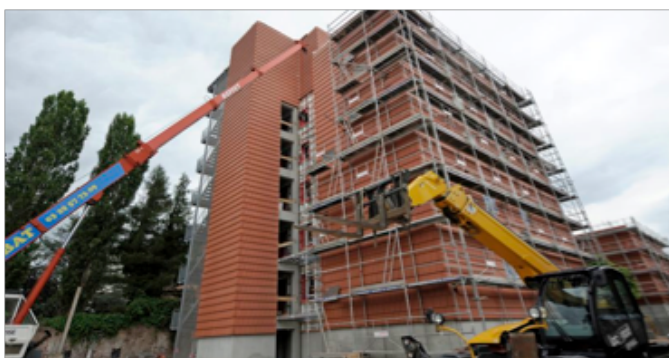
Figure 6. Exemples récents de construction bois

L'industrie du bois a connu une forte évolution de ses métiers, avec l'apport des DAO, CFAO... que ce soit dans les grandes entreprises ou les PME. Cela s'est traduit par un accroissement rapide des qualifications requises. En une trentaine d'années, le nombre d'ingénieurs a été multiplié par près de 10. Mais cela s'est fait au détriment des emplois de techniciens supérieurs remplacés par des ingénieurs. Notons cependant que nombre de secteurs d'activité ont connu une évolution similaire. On observe l'apparition de formations à double compétence : i) architecture/bois se traduisant par une utilisation plus rationnelle du bois dans les constructions ; ii) ingénieurs forêt/bois permettant de mieux faire le lien entre la sylviculture et l'utilisation du bois... même si certains ingénieurs forestiers sont plus enclins à considérer le bois dans la noblesse de l'arbre sur pied, que comme matériau utile pour des utilisations très diverses et de plus en plus prisées !