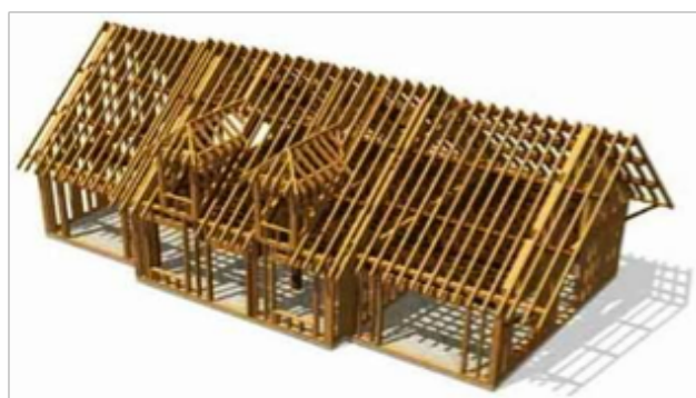
Figure 5. CFAO

C'est un métier traditionnel en pleine évolution avec l'apport de l'informatique. Le charpentier conçoit et réalise des constructions aussi diverses que des charpentes traditionnelles, des maisons à ossature bois, des hangars agricoles, des ateliers, des passerelles ou des bâtiments publics. Il prépare à l'atelier et met en œuvre sur le chantier les ouvrages en bois et en matériaux dérivés du bois. Le charpentier réalise le taillage à l'atelier et/ou sur le chantier. Pour les murs à ossature bois (panneaux, poutres, planchers) l'assemblage se fait habituellement en atelier, avec une mise en œuvre sur le chantier des éléments ainsi préfabriqués, ou sur place en rénovation, après un exercice de montage préalable en atelier. Certaines activités se pratiquent manuellement mais beaucoup sont mécanisées et automatisées. L'évolution des techniques de conception (assistée par ordinateur), de fabrication et de levage facilite le travail et permet une construction plus rapide que les autres modes de construction (fig.5).