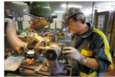
Figure 3. Affûteur