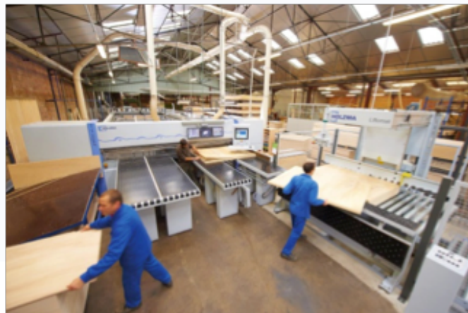
Figure 4. Menuisier industriel

Il réalise des usinages en série par enlèvement de matière (bois ou composite), sur des machines-outils conventionnelles (artisanat), mais de plus en plus à commande numérique. Il réalise les réglages nécessaires à la conduite de production en série. Il est responsable des opérations de débit, d'usinage et de profilage de pièces diverses: meubles, huisseries, portes, fenêtres..., à partir de différents matériaux : bois, panneaux bois et matériaux associés. Il assure l'assemblage des pièces.