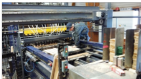
Figure 1. Opérateur de scierie

L'opérateur assure les fonctions indispensables en amont et en aval du sciage proprement dit. Il trie et prépare les bois ou les pièces de bois et en assure le transfert vers et à partir des différentes machines (fig.1). Les emplois d'opérateur de scierie se trouvent en scierie et/ou dans le secteur de l'emballage en bois. Avec de l'expérience et/ou une formation complémentaire, il peut accéder à des responsabilités plus importantes : classeur de bois, conducteur de séchoir ou pilote de scie (fig.2).