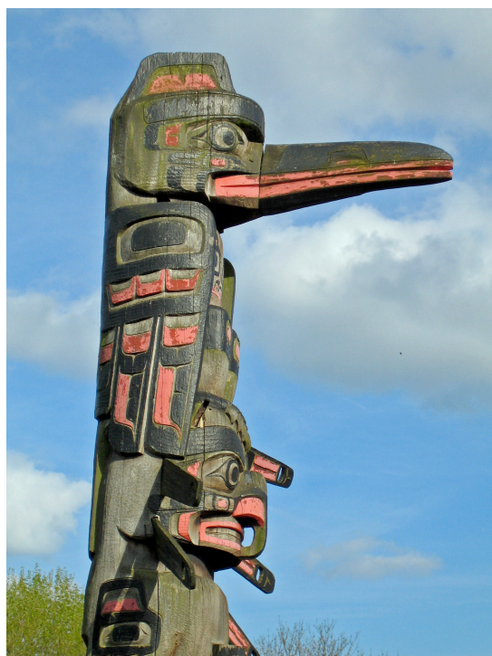
Fig 3. Totem à tête d'oiseau

Dans le naturalisme, l'homme se vit comme étant en discontinuité avec la nature du point de vue de l'intériorité, tout en étant conscient de sa continuité physique avec elle. L'animisme vit tout le contraire, en affirmant la continuité avec la nature du point de vue de l'intériorité, et la discontinuité des mondes humains et naturels, même si tous ceux-ci communiquent entre eux. Dans le totémisme, l'homme se pense comme ayant des qualités physiques et morales analogues à celles de certains non-humains à l'intérieur de groupes bien segmentés. Dans l'analogisme, le monde (à une échelle infra-individuelle) est un gigantesque composite de qualités et d'états différents, reliés par des mécanismes ou des dispositifs de correspondance.