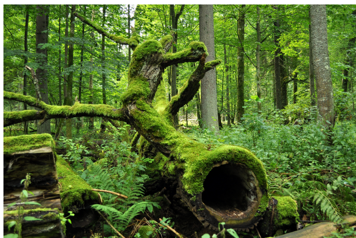
Figure 1. "Parc National de Bialowieza, Pologne, 0029"

La naturalité est la qualité de ce qui est constitué par les seules forces de la nature. Dans le vocabulaire environnemental, elle renvoie au caractère sauvage d'un paysage ou d'un milieu naturel, en opposition avec ce qui est marqué par l'action de l'homme. Il s'agit d'un concept actuellement très débattu, qu'il ne faut pas confondre avec celui de biodiversité : un écosystème très artificialisé peut être très riche en espèces. La naturalité des forêts, en tant que concept des sciences de la nature, est appréciée par la