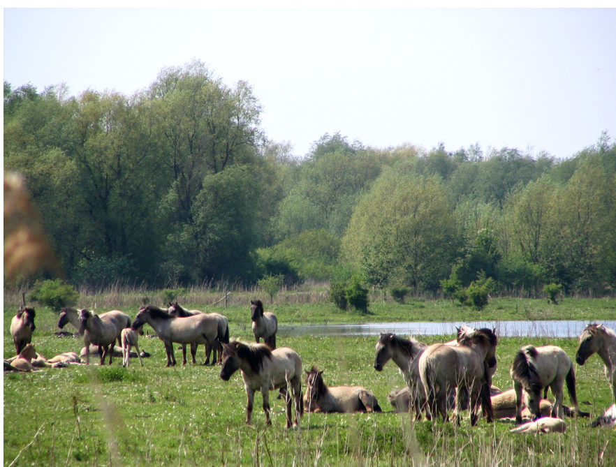
Figure 4. En Forêt de Bialowieza : chevaux koniks polonais réintroduits, espèce la plus proche du cheval tarpan , aujourd'hui disparu.