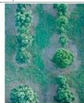
Figure 2 : Vue aérienne du phénomène de brûlé

Père et mère sont génétiquement très proches, et le père est donc sans doute dans l'environnement immédiat de la mère. Pourtant, les tentatives pour retrouver les traces du père sont restées vaines, car on ne détecte jamais son ADN sur les mycorhizes voisines. Nous nous sommes donc demandé si l'écologie des pères n'était pas un peu différente. Il existe, en effet, un phénomène qui suggère que le mycélium de la truffe interagit avec de petites plantes herbacées : autour des arbres "produisant" de la truffe, apparaît une zone de végétation rabougrie, peu dense et faite d'herbes mal développées. On l'appelle brûlé ( Figure 2 ), car elle semble incendiée : elle est composée de la même végétation qu'aux alentours, mais moins dense et avec des individus plus chétifs. On a cherché 8 si la truffe interagissait avec les racines de ces plantes, et si l'on trouvait là ces pères invisibles par ailleurs ; après avoir détecté de l'ADN sur les racines de ces plantes, nous avons eu recours à une méthode de coloration spécifique des filaments de truffe : l'hybridation in situ en fluorescence. Dans