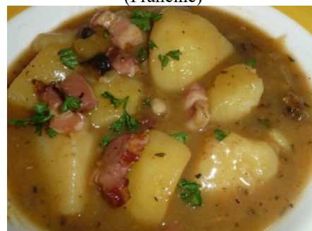
Ragoût de pommes de terre (Toutes Recettes)