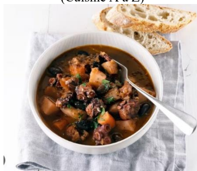
Ragoût de poulpe (Cookidoo)