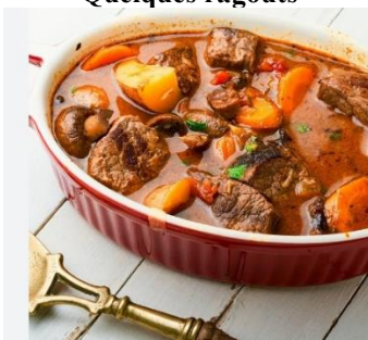
Ragoût de bœuf (Cuisine A à Z)