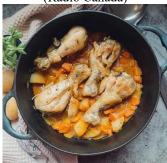
Ragoût de poulet (Petit Poi(d)s Gourmand)