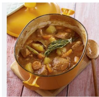
Ragoût de porc (Francine)