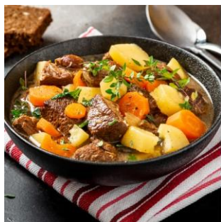
Ragoût d'agneau (Radio Canada)