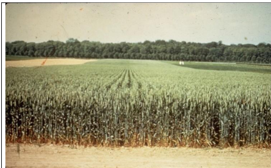
Photo 1 : un champ de blé d'une variété moderne est formé d'un seul génotype. On peut observer pratiquement la même hauteur de tous les épis.

Une autre solution, complémentaire, est d'associer un nombre limité de variétés productives, génétiquement homogènes et de même rythme de développement ; cela est déjà mis en œuvre chez le blé, afin de limiter le développement des maladies et donc l'utilisation de fongicides : on associe trois ou quatre variétés présentant des résistances à des souches différentes du pathogène. Il est même possible de rechercher des situations de coopération entre génotypes d'une association, bien que celles-ci soient rares.