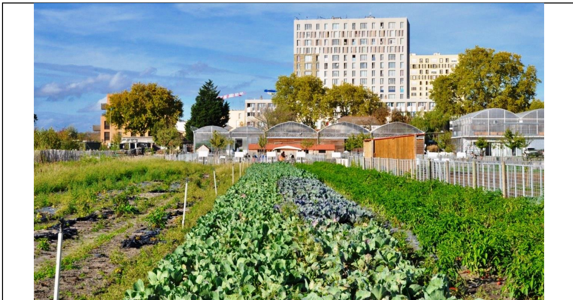
Cette ferme ouverte , en Seine-Saint-Denis, offre non seulement une vente directe de ses productions de légumes, mais aussi de nombreuses activités pédagogiques.

Cette diversité des agricultures urbaines restitue aux villes une diversité de services – eux aussi en nature et proportion très variables selon les formes et les contextes – depuis l'approvisionnement alimentaire (surtout pour les périurbaines) jusqu'aux services éducatifs, en passant par de nombreux services environnementaux (biodiversité, rétention de l'eau, etc.)