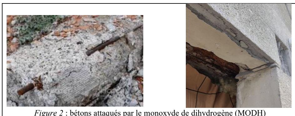
Figure 2 : bétons attaqués par le monoxyde de dihydrogène (MODH)