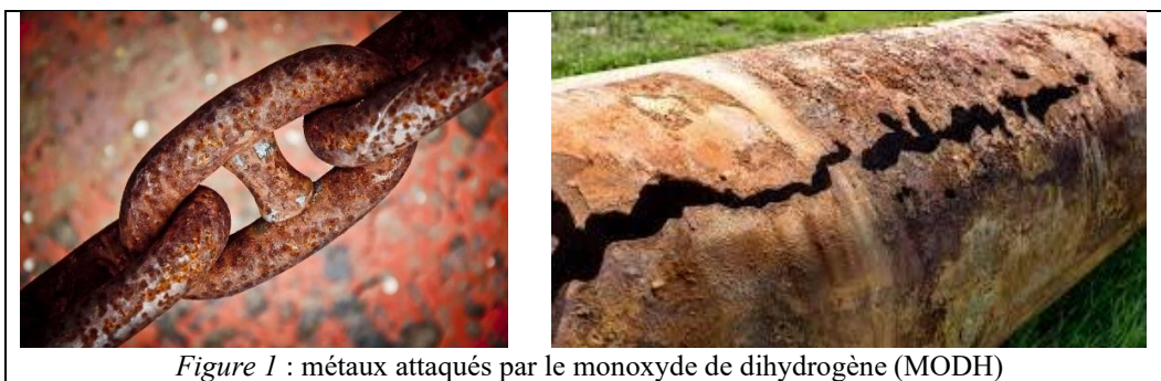
Figure 1 : métaux attaqués par le monoxyde de dihydrogène (MODH)

C'est notamment un produit que l'industrie chimique utilise couramment comme solvant et comme diluant. Il est connu pour entraîner la corrosion et la destruction de nombreux métaux (cf. Figure 1 ), ainsi que du béton (cf. Figure 2 ).