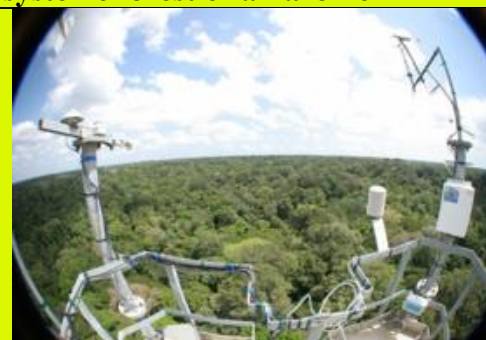
Figure 3 Guyaflux : des capteurs placés en haut d'une tour de 55 m au-dessus de la canopée mesurent les échanges hydriques et gazeux entre la forêt et l'atmosphère

L'Unité Mixte de Recherche ECOFOG ( Écologie des Forêts de Guyane ) regroupe des moyens d'AgroParisTech, d'INRAE, du Cirad, du CNRS, de l'Université des Antilles et de l'Université de Guyane. Basée à Kourou et Cayenne, elle fait partie du Laboratoire d'Excellence « Centre d'Études de la Biodiversité Amazonienne » qui comprend d'autres laboratoires de France métropolitaine. Son objectif est d'intégrer différentes approches en écologie et sciences des matériaux pour : i) comprendre les relations entre biodiversité et fonctionnement des écosystèmes forestiers tropicaux, exploités ou non, en évolution sous les pressions climatiques et anthropiques ; ii) susciter l'innovation dans la valorisation des ressources forestières dans le contexte de cette forte biodiversité en tenant compte des contraintes d'utilisation liées au milieu tropical humide.