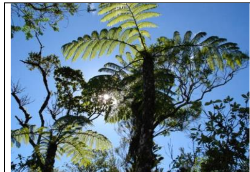
Figure 6 : le fanjan, une fougère arborescente (photo ONF)

Île jeune, surgie de la mer il y a 3 millions d'années, La Réunion a été colonisée spontanément par des plantes (graines) et animaux véhiculés par les vents, les cyclones et les courants marins depuis les régions voisines de l'Océan Indien. Dans des contextes de relief marqué par le volcanisme (toujours actif), de fortes variations d'altitude (de 0 à 3 070 m), de sols variés et de climats contrastés, certaines espèces se sont adaptées ou différenciées du fait de l'isolement géographique. Le résultat de ces processus évolutifs est spectaculaire en termes de diversité biologique : on dénombre ainsi plus de 150 espèces d'arbres et plus de 200 espèces d'arbustes et arbrisseaux sur ce territoire, somme toute, exigü ; la proportion d'espèces endémiques y est forte (34 %). Pour cette raison, La Réunion, comme Madagascar et d'autres îles du sud-ouest de l'Océan Indien, a été classée comme haut-lieu de la biodiversité par l'UICN. Sa protection est assurée grâce à un ensemble d'instruments : Parc National de la Réunion créé en 2007 (dont la zone de cœur du Parc est constituée à 85 % de forêts départementalo-domaniales, gérées par l'ONF), réserves biologiques intégrales (comme celle du Piton de la Fournaise) et dirigées, réserves naturelles nationales, toutes gérées par l'ONF, auxquelles il faut ajouter les mesures de protection figurant dans les plans de gestion (dits aménagements) des forêts publiques.