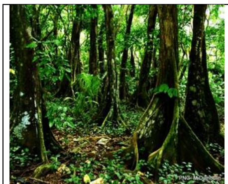
Figure 5 : Forêt marécageuse de Guadeloupe : mangle médaille