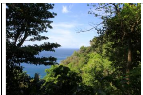
Figure 4 : Forêt côtière Anse Couleuvre Martinique