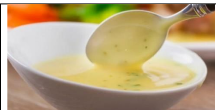
Sauce prête à agrémenter un plat

Ensuite, c'est tout simple : il suffit de mettre le beurre dans la casserole et de chauffer doucement en fouettant. Le beurre fond, et le fouet divise la matière grasse fondue en gouttelettes qui viennent se disperser dans l'eau. Attention toutefois : ce travail se fait à chaud, et de ce fait l'eau s'évapore ; alors, si l'on n'y prend pas garde – en chauffant trop ou trop longtemps – on risque de ne plus avoir assez d'eau pour faire l'émulsion, qui viendra à tourner !