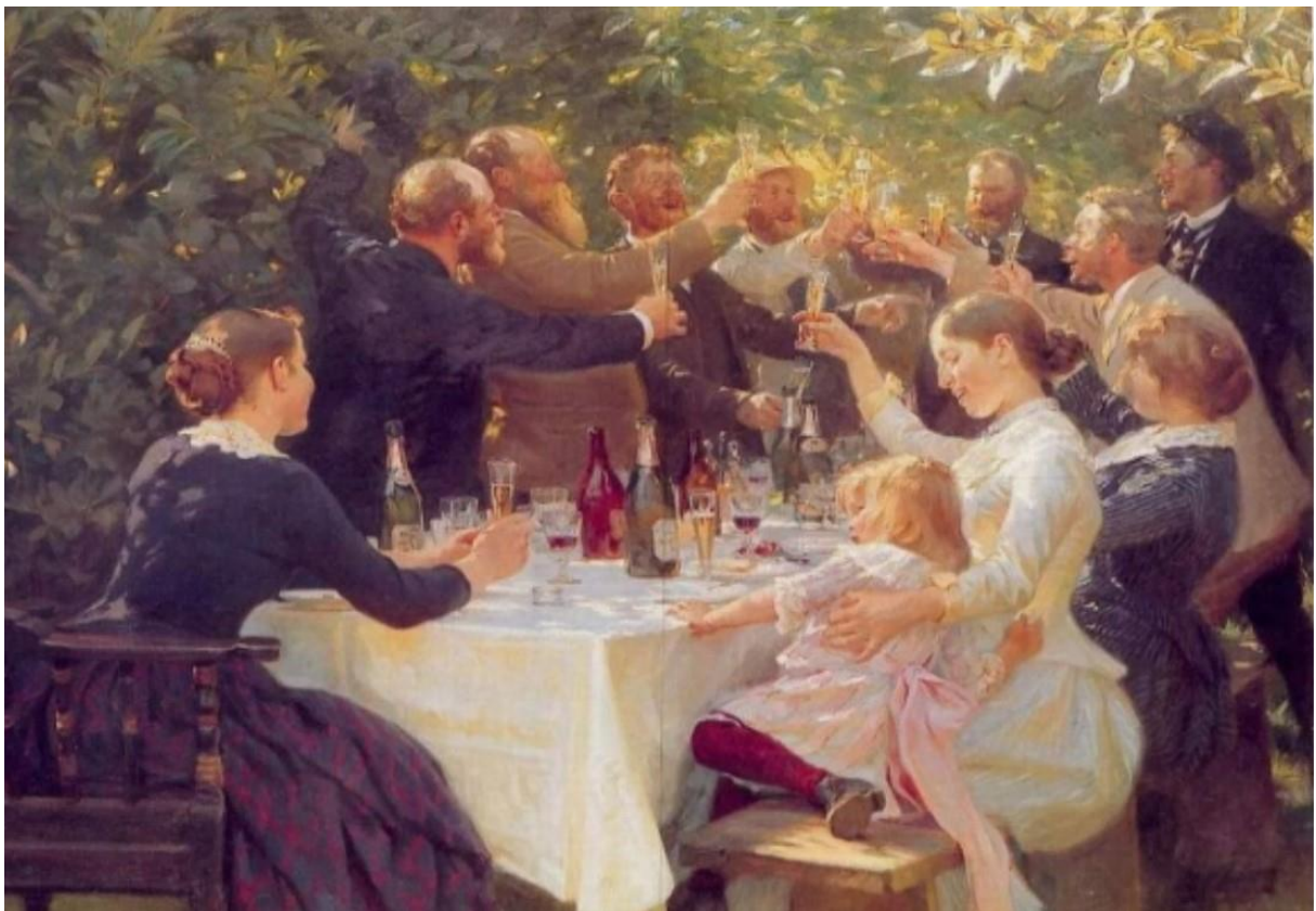
Hip hip hooray! Artists' celebration at Skagen, Peder Severin Krøyer (1851-1909)