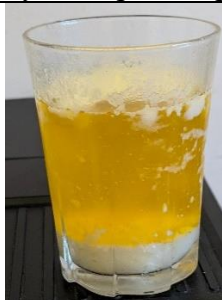
Clarification eau/lipides : par chauffage doux du beurre, la grasse monte en surface et l'eau reste au fond

D'ailleurs, si l'on chauffe doucement le beurre, on obtient la clarification , c'est-à-dire qu'une phase aqueuse se dépose au fond du récipient et qu'une phase grasse liquide occupe le dessus. C'est le beurre clarifié .